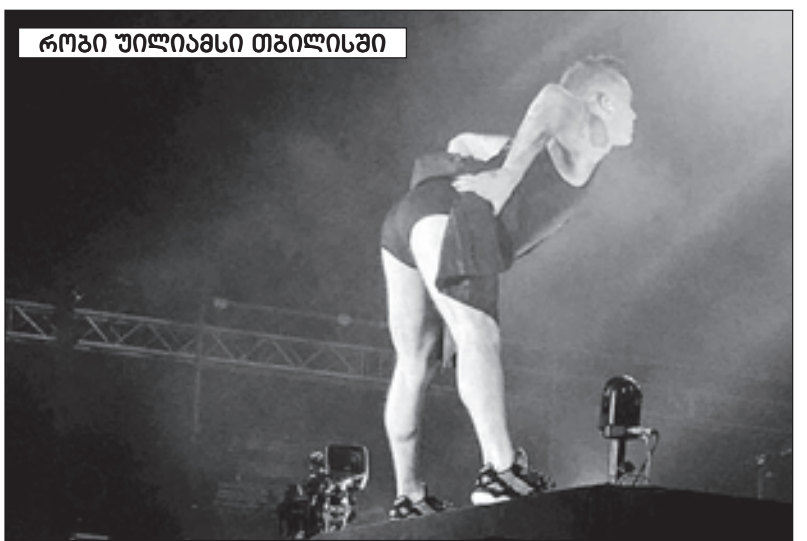
როზი უილიამსი თბილისში