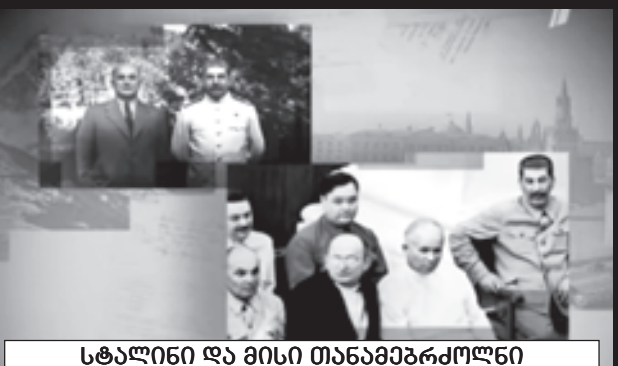
სტალინი და მისი თანამებრძოლები