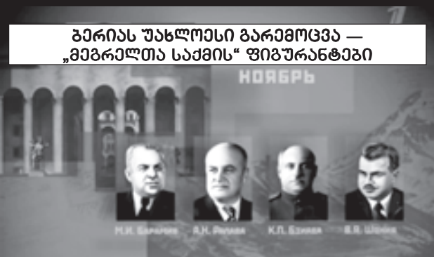
ბერიას უახლოესი გარემოცვა — „მეგრელთა სამხრის“ ფიგურანტები