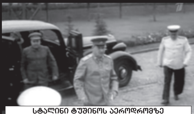
სტალინი ტუშინოს აეროდრომაზე

ქვეყანაში მოქალაქეთა ცხოვრების რეალური დონის შესახებ ბერიამ საბჭოთა ქვეყნის სხვა ხელმძღვანელებზე უკეთ იცოდა. მოუგზავნიდა სახელმწიფო უშიშროების სამინისტროს ნაპოვნებს, გლეხების გალატაკება. ბერია გამოდიოდა სამხედრო ხარჯების შემცირებისა და კვირად ღირებულებების შემცირების საკითხზე. მისი მოთხოვნით მან წამოაყენა წინადადება სახალხო მუშრენიზმის მართვაში პარტიის ჩარევის მინიმუმამდე დაყვანის შესახებ. დაიწყო რესპუბლიკებში ხელმძღვანელთა ექიმებმა რეაბილიტაციის სასჯელის დაკრძალვით რამდენიმე კათოლიკური, ანუ მკვიდრი მოსახლეობის წარმომადგენლების დანიშნულება. ის აქტიურად ჩაერთო საერთაშორისო პრობლემების მოგვარებაში. მისი მოთხოვნით დაიწყო მოლაპარაკე-