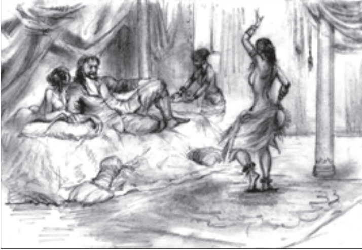
„ჰარეში“ — ნ. კიკალიშვილის ნახატი

კარის საქმიანობა ზემოთ ხსენებული ქალების დახმარებით, მერე ეს ყველაფერი დანერა და ევროპაში უთვალავი მკითხველი გაიჩინა, ალბათ, იმიტომ, რომ ყველა აღუწერელი ამბავი სინამდვილეა და ჰარამხანის საიდუმლოებას ეხება, ავტორმა თავისი ვინაობა დაუმალა საზოგადოებას, რათა საკუთარი თავიცა და სხვებიც ხიფათისაგან გადაერჩინა. ეგებ ქალების სახელები და გვარებიც გამოგონილი იყოს სხვადასხვა მოსაზრების გამო. მაგრამ ერთი რამ ცხადია, აქ მოთხრობილი ამბავი ჭეშმარიტებაა. ჰარამ არაბულად ნიშნავს ხელშეუხებელს, წმინდას. ჰარამხანა მაჰმადიანების სახლის იმ ნაწილს ეწოდება, სადაც მამაკაცებისაგან განცალკევებით ცხოვრობენ ქალები. მუსლიმანების შეხედულებით, ხელისუფლების არც ერთ წარმომადგენელს, სასულიერო პირი იქნება ის თუ საერო, არც გარეშე მამაკაცებს, შინაურებსაც კი, გარდა სახლის პატრონისა და მისი შვილებისა, ნება არ აქვთ, ჰარამხანის ზღურბლს გადააბიჯონ. გამონაკლისი არიან სულთანი და შაჰი. აღმოსავლეთში გავრცელებული თვალსაზრისით, სამეფო ტახტის მფლობელის ჰარამხანაში შესვლა ბედნიერების სანინდარია.