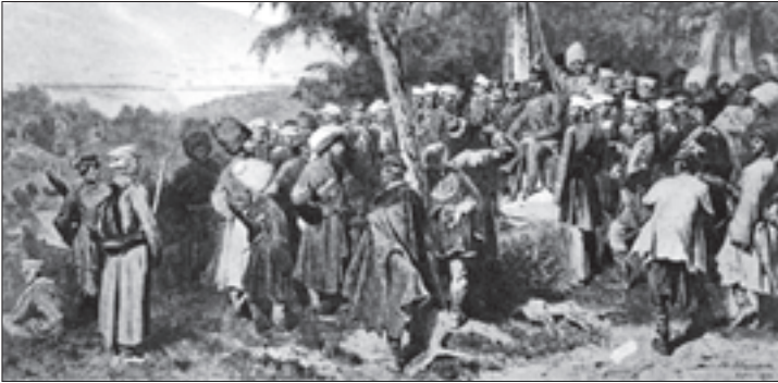
შამილის ტყვედ ჩაპარდნა

„საყოველთაო ილუსტრირებულ ჟურნალში“ გამოქვეყნდა ე. ტექსეს სტატია „შამილი“, მალე ტექსემ გამოსცა ნიგნი „შამილი“ სერიით „აღმოსავლეთის ომის ადამიანები“.