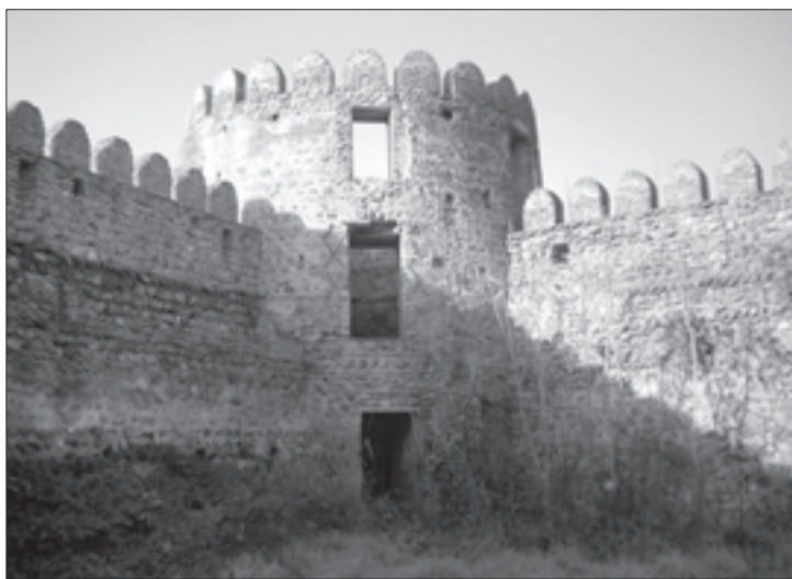
ნურსალ ბეგი გაერთიანებული ჯარით ყვარლის ციხეს შემოადგა

ასეთ ვითარებაში, რასაკვირველია, ყვარლის ციხისთვის ბრძოლამ თეიმურაზ-ერეკლესათვის უდიდესი სტრატეგიული მნიშვნელობა მიიღო, პაპუნას სიტყვით, თუ ისინი ამ ციხეს აიღებდნენ, მაშინ მათ გაღმა-მხარიც დარჩებოდათ, მთელ კახეთსაც ადვილად დაიპყრობდნენ და დასუსტებული ქართლისაკენაც ვერაფრით ვერ შეამაგრებდნენ. ამის გამო იყო, რომ თეიმურაზ-ერეკლემ თითქმის ტოტალური მობილიზაცია გამოაცხადეს და ამასთან, სათანადო ჯილდოებიც კი დაანესეს (მათ შორის საკომლო მამულის გაცემა, სათარხნის მიცემა და სხვ.). პაპუნა წერს: მეფეებმა „იარალის ამღები აღარავინ დაადო შინა გლეხი, თორემ თავადი და აზნაურთაგანი ვინ დააკლდებოდაო. ერეკლემ თავისი იშვიათი სამხედრო მოხერხებულობით ყვარელთან ბრწყინვალე გამარჯვებას მიაღწია და ამით ნურსალბეგს ხელი ააღებინა თავდაპირველ განზრახვაზე. ყვარლის ციხის ბრძოლა, თავისი მნიშვნელობის გამო, „ასწლიანი ლეკური ომის“ პირობებში, თამამად შეიძლება მივიჩნიოთ ერთგვარ მარტყოფად თუ ბახტრიონად.