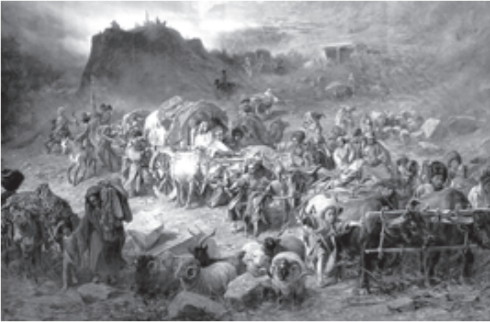
პეტრე ნიკოლოზის კი გრუზინსკი — „მთიელაზი აულს ტოვაპინ“

მარეობა მოუპოვა ისედაც გავრცელებულ ისლამს. მანსური თავის თავს წინასწარმეტყველად აცხადებდა, შეიხად (მეთაურად) და იმამად (ისლამის რელიგიურ მეთაურად). მალე მის გარშემო 12 ათასამდე მეომარი შეიკრიბა.