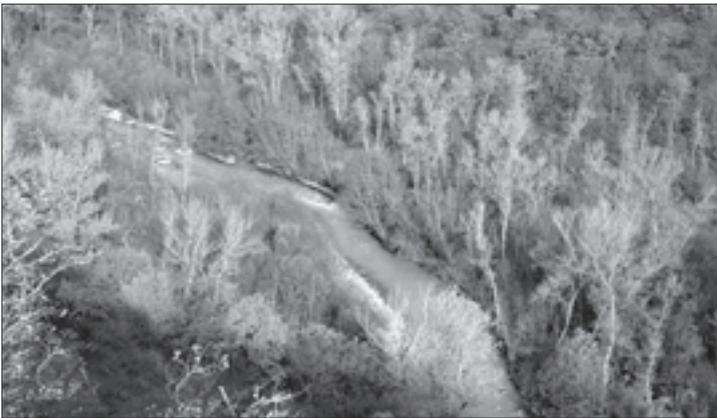
მდინარე ივრის ხეობა

მანსურის მეთაურობით გაჩაღებულმა მოძრაობამ საფრთხე შეუქმნა რუსეთის გეგმებს ამიერკავკასიაში. ამ გარემოებამ უარყოფითი გავლენა იქონია საქართვე- ლოს მდგომარეობაზე. ოსმალეთის აგენტმა ომარ-ხან- მა საქართველოში დიდი ლაშქრობისათვის უაღრესად ხელსაყრელი დრო შეარჩია; შეიხ მანსურმა წინა კავკა-