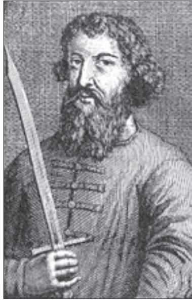
არჩილ II (1647-1713)

ჭარელთა ეს თავდასხმა შარვანზე ერთგვარად დასაწყისი აღმოჩნდა სეფევიდების ბატონობის წინაღობაზე უკვე მომნიშვნელებული აჯანყებისათვის. მართალია, ეს აჯანყება თავდაპირველად ანტიფეოდალური და ანტიირანული იყო, მაგრამ ჩქარა გაბატონებულმა კლასმა, თურქეთის ამკარა მხარდაჭერით, მას მხოლოდ ანტიირანული ხასიათი მისცა. აჯანყების სათავეში