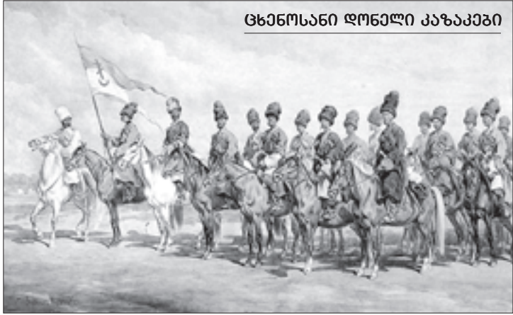
ცხენოსანი ღონელი კაზაკები

ქართველოს სამხედრო გზაზე ძარცვავდნენ მგზავრებს“. ქართველ უფლისწულთა მიერ ნაქეზებულნი (რომლებიც იმერეთში იმყოფებოდნენ) დარწმუნებული იყვნენ, რომ რუსული ჯარები, რომლებიც ამჟამად საქართველოში იდგა, მალე დაუბრუნდებოდა კავკასიის ხაზს. ეს თავდასხმები რომ აღეკვეთა, გენერალმა ი. პ. ლაზარევმა ითხოვა მათ წინააღმდეგ ძალის გამოყენება.