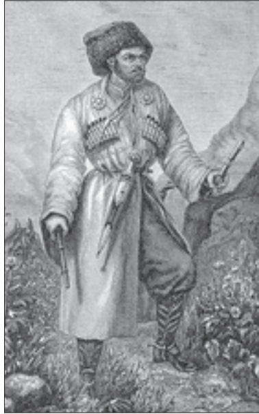
ჰაჯი-მურატი, იმამ შამილის პირველი ნაიბი

1851 წელს, თორმეტი წლის განმავლობაში მოპოვებული წარმატებების შემდეგ, რუსების მხარეს გადავიდა იმამ შამილის ერთ-ერთი საუკეთესო ნაიბი — ჰაჯი-მურატი. მან შამილისაგან ბრძანება მიიღო, საუკეთესო მიურიდების ჯგუფთან ერთად (დაახლოებით 600 კაცი) კაიტახსა და ტაბახარანში წასულიყო ადგილობრივი მოსახლეობისთვის მიურიდიზმის სწავლებისა და დერბენტის შემოგარენზე თავდასახმელად რაზმის ორგანიზებისთვის, ასევე, თემირ-ხან-შუროსთან კავშირის გაწყვეტის მიზნით.