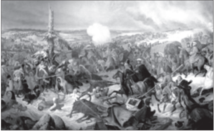
ერთ-ერთი ბრძოლის ეპიზოდი

ბასტიანის მეთაურობით გაგზავნა ლეკების კვალზე, დანარჩენებთან ერთად კი თვითონ წავიდა, დააყენა რა ქვეითთა წინ კაზაკები, რომლებმაც ალაზანთან მთიელ მონადირეებს ერთბაშად შეუტყის. შემდეგ მივიდნენ ქვეითები და დაიწყეს ლეკთა ხოცვა, რომლებიც გაქცევით თავის გადარჩენას ცდილობდნენ, ჩქარობდნენ, სადაც შეძლებდნენ, იქ შედიოდნენ მდინარეში და ფონს აღარ ეძებდნენ. მაგრამ რაკი ხშირი ნვიმების გამო მდინარე ადიდებული იყო, ისინი ხშირ შემთხვევაში იხრჩობოდნენ. ამ ბრძოლაში მთიელებმა დაკარგეს 325 კაცი, რუსებს მხოლოდ 11 ადამიანი მოუკლეს და დაუჭრეს. ჯარების ზემდეგი ვ. ი. ეფრემოვი გამოჩენილი სიმაძაცისთვის დააჯილდოვეს წმ. ანას მესამე კლასის კავალერიის ჯვრით.