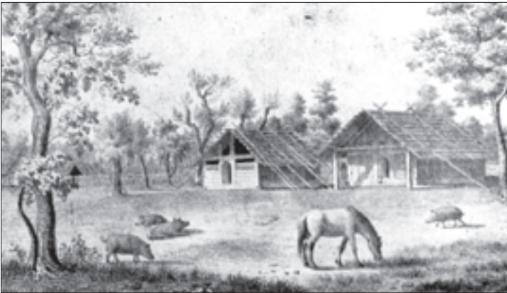
დიუზუა დე მონარეს ნახატი „გლახის კარ-მიდამო იმერეთში“

მაგრამ, როგორც აღვნიშნეთ, განსაკუთრებით სავალალო იყო მდგომარეობა იმერეთში . იქ არაჩვეულებრივმა