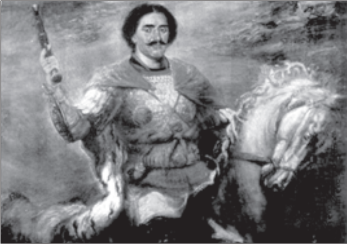
სოლომონ I, იმერთა მეფე

დგარ თურქეთ-ყირიმხანისა და ირანთან შედარებით, ამიტომ, ბუნებრივია, რომ საუკუნეთა მანძილზე ქართველ პოლიტიკოსთა ორიენტაციაც მის მიმართ, მიუხედავად კავკასიაში დროდადრო წარუმატებლობისა და დროდადრო თურქეთ-ირანის აღმავლობისა, მაინც ერთგვარად ურყევი იყო.