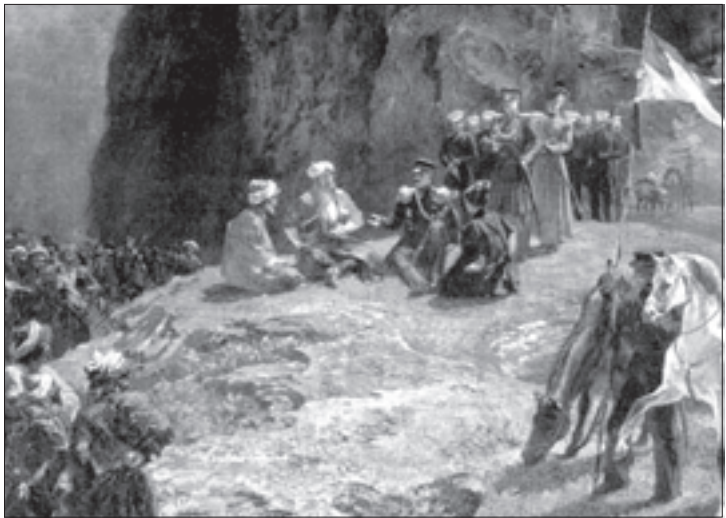
განერალ ფონ კლიუგენაუს შესველრა შაჰილთან, 1837წ., მხატვარი ბრიგოლ გაბარინი

ღრიალითა და ტრიუმფალური შეძახილებით, ლეკები ჩვენი აივნისაკენ მოიწვედნენ და იმდენად მოგვიახლოვდნენ, რომ უკვე მათი ნაბიჯების ხმა გვესმოდა; ამან უკიდურეს სასონარკვეთაში ჩაგვაგდო. ყველამ დავიჩოქეთ,... ლეკებ-