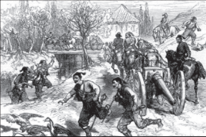
ოსმალეთი კარცვავენ სოფელს

ბა და შიში გამოიწვია. ერეკლე მეფეს ირანში გახელმწიფების სურვილი შესწამეს. ერეკლეს აგენტებმა ჩქარა გამოარკვეეს, რომ ხანებს შექის მფლობელთან მიმონერა გამართათ და ქართველთა საღალატოდ ემზადებოდნენ. ასეთ პირობებში ლაშქრობაზე ფიქრი აღარ შეიძლებოდა.