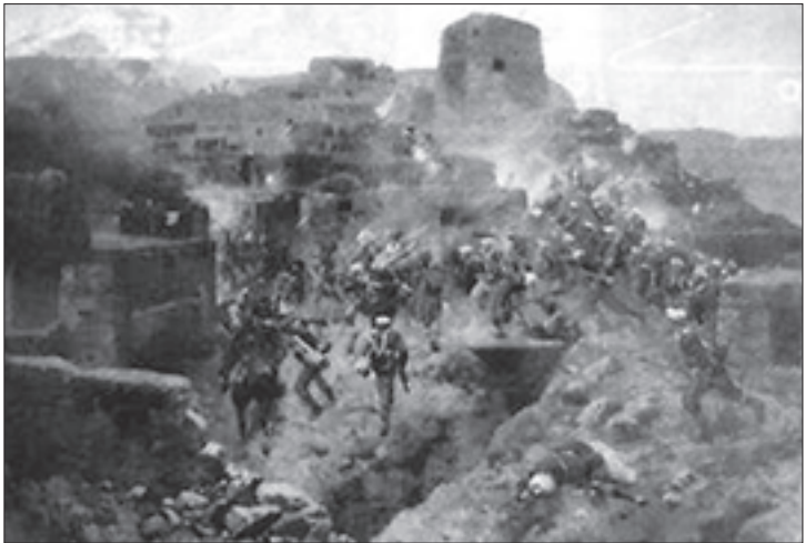
რუსი ჯარისკაცების შეტაკება ჩრდილოკავკასიელ მოთარაშეებთან

XVI ს. მოყოლებული, კახეთი თავს იცავდა მთიელთა თავდასხმებისაგან. დაახლოებით ორი საუკუნის მანძილზე კახელი გლეხობა წინააღმდეგობას უწევდა მთიელ თავდამსხმელებს. ამავე დროს, კახეთი შაჰის სახანოს წარმოადგენდა. გარეშე მტრებთან ბრძოლებში მოსახლეობის ნაწილი განწყდა, ნაწილი კი ტყვედ იქნა წაყვანილი. როგორც წესი, ბრძოლებში ცუდად შეიარაღებული, ნაკლებად თავდაცული მწარმოებელი საზოგადოება მცირდება. ირღვეოდა პროპორცია მწარმოებელსა და მფლობელს შორის, ეს კი ფეოდალური ურთიერთობის გამწვავებას იწვევდა. შეთხელებულ მწარმოებელ საზოგადოებას მძიმე ტვირთად აწვა ადგილობრივი ფეოდალური თუ უცხოელ დამპყრობთა მიერ დაკისრებული ვალდებულებანი და გადასახადები. კახელი გლეხი ამ მდგომარეობას ხშირად „გალეკებით“ იცილებდა თავიდან. როგორც აკად. ნ. ბერძენიშვილი განმარტავს: „კახელი გლეხები „ლეკობაში“ „უბატონობას“ ხედავდნენ და ეს კი საბოლოოდ ყოველივე დაბრკოლებას სძლეოდა: კახელი გლეხი „გალეკებაში“ უბატონობას ეძებდა.