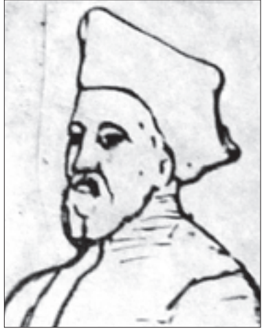
კრისტოფორო დე კასტელი, აპტომორტრეტი

იტალიელი მისიონერი, პატრი, თეატინელთა ორდენის წევრი. მოღვაწეობდა XVII საუკუნის პირველ ნახევარსა და შუა წლებში. საქართველოში 1628 წელს ჩამოვიდა პატრანტონიო ჯარდინასა და ბერ კლაუდიოსთან ერთად. მისიონერები მივიდნენ ქალაქ გორში თეიმურაზ პირველთან, ხოლო 1634 წელს შემოქმედელი ეპისკოპოსის — მაქსიმე მაჭუტაძის მიწვევით გურიაში გადავიდნენ. 1640 წელს ვახტანგ II გურიელმა ისინი