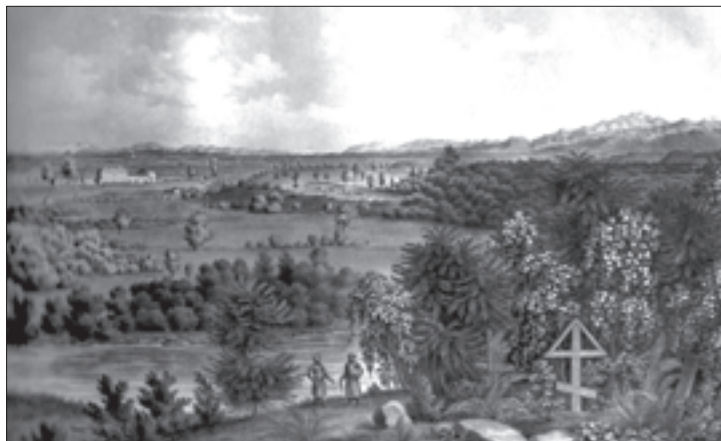
მცხეთაში, 1830 წ. დიუბუას ნახატი

ამასთანავე უნდა აღინიშნოს ის ფაქტიც, რომ ამ ოქმებიდან მტკიცდება, თუ რა სასტიკი იყო ხალხის განა-