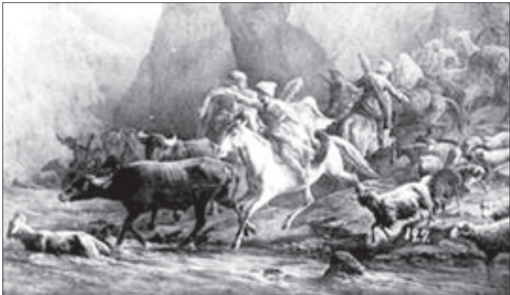
ლეკები ნადავლით ტოვებენ სოფელს

შაჰ-აბასის შემოსევების შემდეგ, კახეთის აოხრებით დაღესტნელებს გზა გაეხსნათ. ამიერიდან, ზემოთ მოყვანილი დებულების თვალსაზრისით, მდგომარეობა არსებითად შეიცვალა. საქმე ისაა, რომ ლეკთა თავდასხმები წინა პერიოდთან შედარებით გახშირდა და გამსხვილდა; ამასთან, სწრაფი ტემპით დაიწყო ქართულ მიწა-წყალზე პირიქითა კავკასიის ლეკურ მოახალშენეთა კომპაქტურად ჩამოსახლებისა და დამკვიდრების პროცესი, რასაც, თურქეთ-ირანის ხელშეწყობით, XVII-XVIII სს. მიჯნიდან მოჰყვა ამ ლეკური მოსახლეობის ზედა ფენისა და დაღესტნის ფეოდალთა თითქმის განუწყვეტელი „ასწლიანი ლეკური ომი“ და ამის შესაბამისად — „დროშემოუსაზღვრელი“ ბატონობა, ვიდრე საქართველოს რუსეთთან შე-