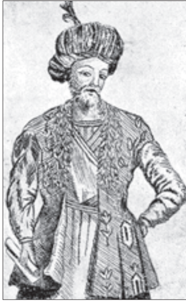
ქართლის მეფე როსტომი (სოსრო მირზა) კრისტოფელ კასტელის ნახატი

ამიტომ იყო, რომ კახეთის მმართველი ყიზილბაში ხანები (1677 წ. ბეჟან-ხანი, 1683 წ. აბაზ-ყული ხანი, 1692 წ. ქალბალი-ხანი და სხვ.) მეტად მტრულად მოეკიდნენ კა-