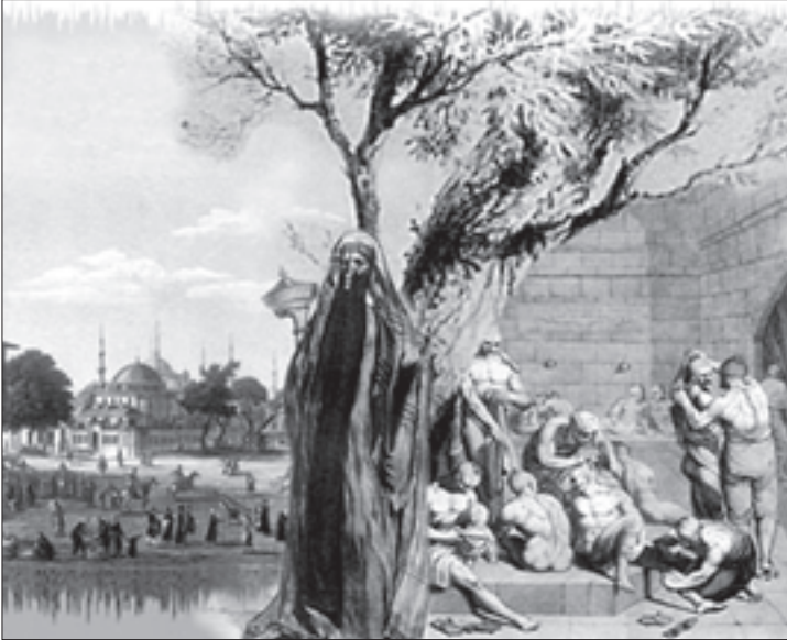
ლევაშოვის თვალთ დანახული ისლამური სამყარო

ხელისუფლების მიერ გატარებულ ამ და სხვა ღონისძიებებს უდავოდ ჰქონდა პრევენციული მნიშვნელობა ადამიანებით ვაჭრობისა და სხვა დანაშაულობათა წინააღმდეგ. მაგრამ ამ ეტაპზე მიღწეულად უფრო სამხედრო და ამკრძალავი ღონისძიებების შედეგები ჩაითვლებოდა, ვიდრე ეკონომიკური ზრდა და სოციალური ცვლილებები. ამ დროისათვის შავი ზღვის სანაპირო კარგად იყო დაბლოკილი და დაცული გარეშეებისაგან. რუსეთის საბრძოლო ხომალდები სისტემატურად მიმოდრიდნენ ჩრდილო-აღმოსავლეთი სანაპიროს გასწვრივ. სანაპირო სი-