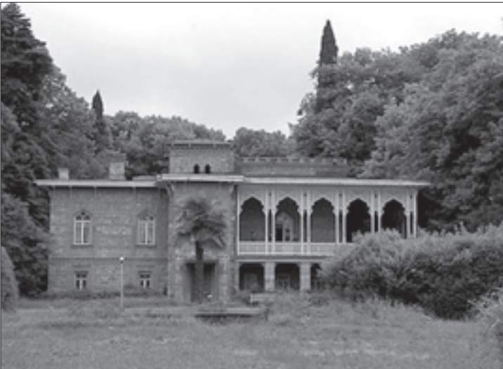
ჭავჭავაძეთა სასახლე წინანდალში

უცებ ვილაცამ ხელზე ძლიერ მომქაჩა. კნეინას მიტოვება არ მენადა, მაგრამ ტყვე ქალს ხომ არ შეემძლო, ჩემს ნებაზე ვყოფილიყავი და მაშინვე საკუთარ ადგილს მივაშურე. ამის შემდეგ ჩემ თვალწინ დატრიალდა სისხლიანი ტრაგედია, რამაც მთელი სხეული ამითრთოლა: კნეინას ახლოს გაიმართა საშინელი შეტაკება. თუმცა ქალბატონი ოდნავადაც არ შერხეულა, რათა მოსალოდნელი საფრთხე აეცილებინა. შეტაკება კი მისი მითვისების მიზნით მოხდა. მტაცებელთაგან ბევრი ხვდებოდა, რომ კნეინა ძვირფასი ნადავლი უნდა ყოფილიყო და მის გამო ერთი მეორეს გააფრთხილებდა. ბოლოს და ბოლოს ჩხუბი დასრულდა და კნეინა, ჩემს მსგავსად, ერთ-ერთ მეპატრონეს მიეკუთვნა, რომელიც დაიხარა და ჰკითხა: